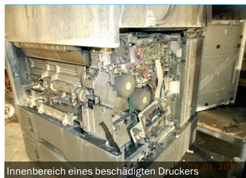
Innenbereich eines beschädigten Druckers

Sonntag, 10 Uhr morgens, erhalten wir einen Anruf auf unsere 24h Hotline. Ein Ladenlokal mit Werkstatt und Lager – eine Fläche von insgesamt 300m 2 – wurde Opfer der Flammen. Auch Gebäudeteile sind betroffen. BELFOR macht sich unverzüglich an die Arbeit, Sofortmassnahmen werden eingeleitet. Wir beginnen mit den Sicherheitsabgrenzungen, dem Abtransport der beschädigten Teile und versuchen die Unannehmlichkeiten der anderen Bewohner einzuschränken. Das primäre Ziel besteht darin, den normalen Geschäftsverlauf nicht zu unterbrechen. BELFOR räumt und saniert in einen Nebenraum das erforderliche Material, damit die Ladenöffnung am Montag garantiert ist. Der Kunde ist mehr als zufrieden. Unser prompter Einsatz und die professionelle Arbeit vor Ort veranlassen den Kunden, uns weitere Renovationsarbeiten in Auftrag zu geben.