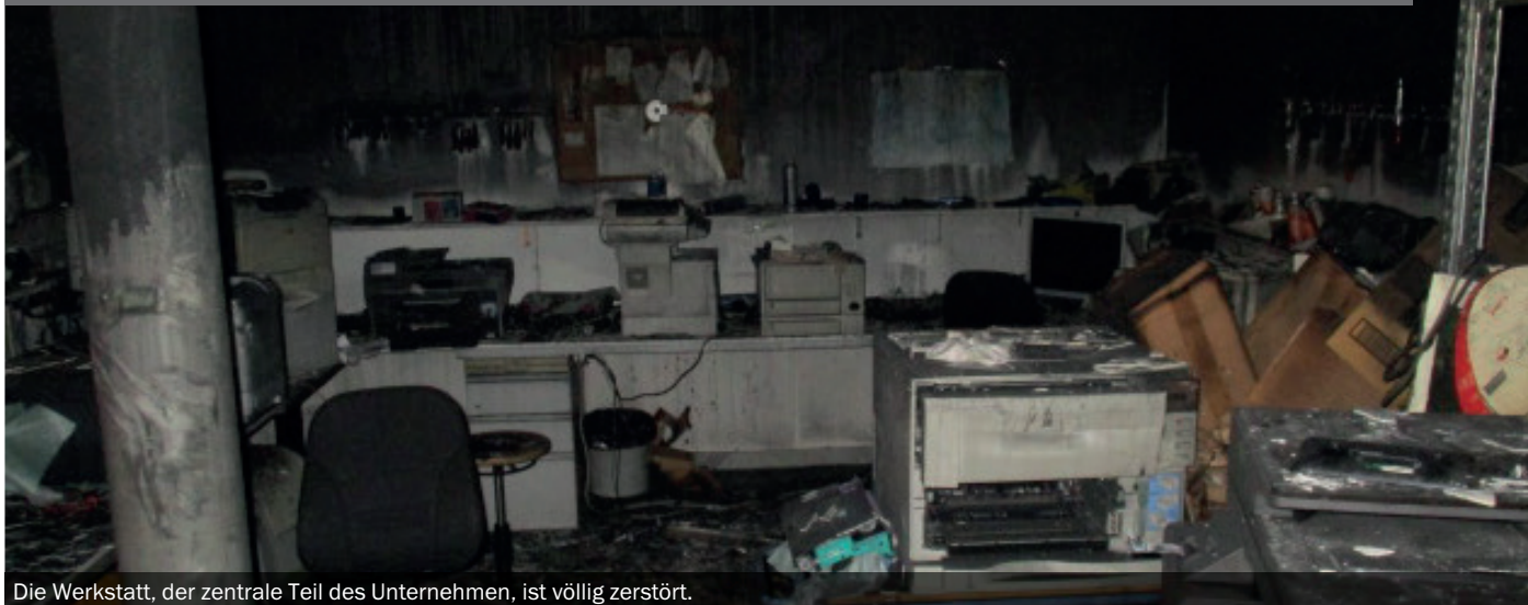
Die Werkstatt, der zentrale Teil des Unternehmen, ist völlig zerstört.