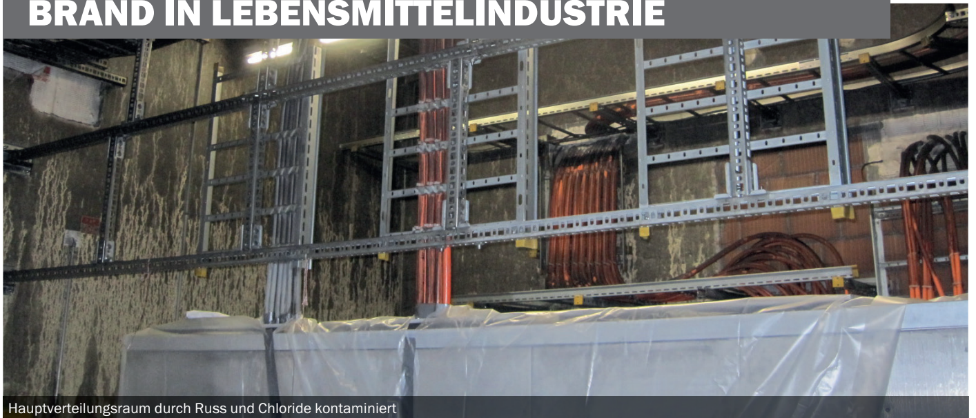
Hauptverteilungsraum durch Russ und Chloride kontaminiert