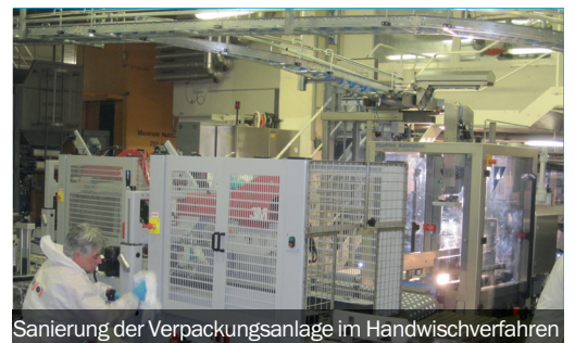
Sanierung der Verpackungsanlage im Handwischverfahren