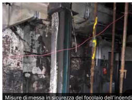
Misure di messa in sicurezza del focolaio dell'incendio

LA TEMPESTIVITÀ DELL'INTERVENTO È UN FATTORE DECISIVO!