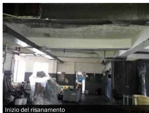
Inizio del risanamento

Il personale addetto al risanamento si è messo subito al lavoro per conservare cassette, attrezzi, macchinari, ecc. Così facendo è stato possibile evitare che la corrosione si propagasse ulteriormente. Il giorno successivo sono iniziati i veri e propri lavori di risanamento. Gli interventi hanno riguardato ogni elemento, le pareti e il soffitto sono stati puliti con un detergente speciale. Contemporaneamente tutti gli strumenti sono stati risanati e resi nuovamente utilizzabili.